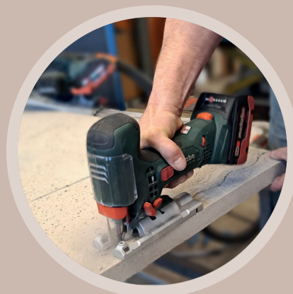
⇒ DÉCOUPE À LA SCIE SAUTEUSE