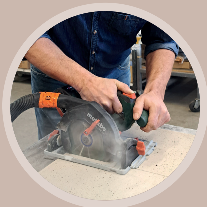
⇒ DÉCOUPE À LA SCIE CIRCULAIRE PORTATIVE

INFORMATIONS DE COMMANDE : PLAQUES DE CONSTRUCTION DE CHEMINÉES SUPER EASY Numéro d'article : 776754, 1 palette = 18 plaques